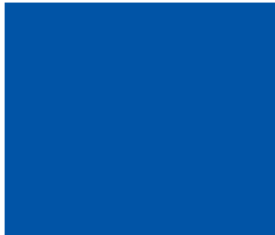
DIC COLOR 255